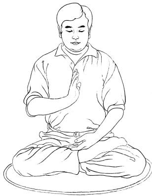
Držeći jedan dlan uspravnim